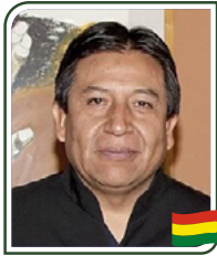
David Choquehuanca Céspedes

Vicepresidente del Estado Plurinacional de Bolivia