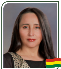
Dra. Elva Terceros Cuéllar Magistrada del Tribunal Agroambiental del Estado Plurinacional de Bolivia